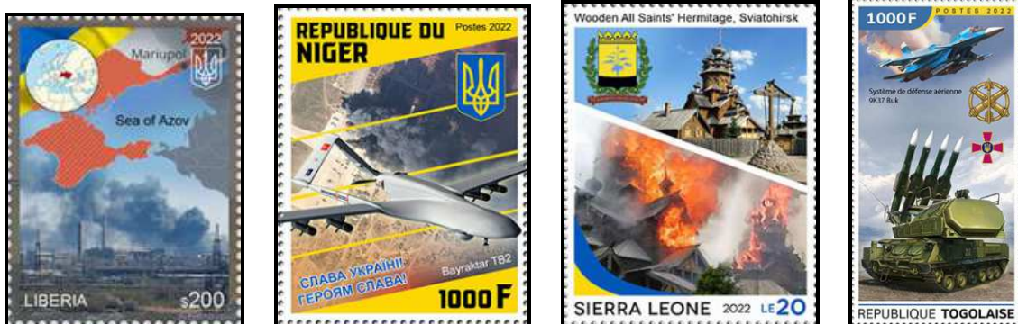
Die hier gezeigten Randgebietsmarken mit Brandszenen stammen alle aus Kleinbogen.

Weltweit meldeten sich bereits kurz nach Kriegsbeginn Persönlichkeiten des öffentlichen Lebens als Unterstützer der Ukraine zu Wort. Einige davon sind auf vier Marken eines KB „Celebrities supporting Ukraine with donations“ vom 25.3.22 zu sehen, auf zwei Werten abgebildet vor brennenden Gebäuden.