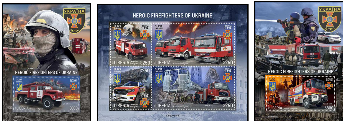
Eine Liberia-Ausgabe „Heldenhafte Feuerwehrangehörige der Ukraine“ erschien am 27.6.2022

Feuerwehrfahrzeuge als Motiv dominieren vier KB- und die Blockmarke der unter dem Titel „Les Pompiers Ukrainiens“ in den Handel gebrachten Ausgabe. Die Themenzugehörigkeit erschließt sich durch kleine Einsatzszenen auf den Einzelwerten, eine Mittelvignette des KB sowie durch den Blick auf den Schmuckteil der Blockausgabe.